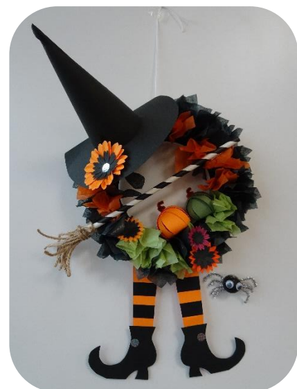
※見本は図書室に掲示します