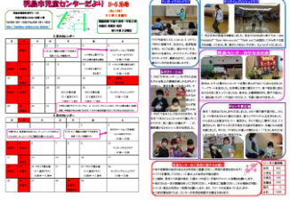
〈児童センターだより〉

児童センターでは、申込制のものから自由参加のものまで色々な行事をしていますよ。 下記のURLで検索してみてくださいね。 URL : http://hashima-shakyo.or.jp/jidokan/