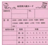
〈入館カード幼児用〉