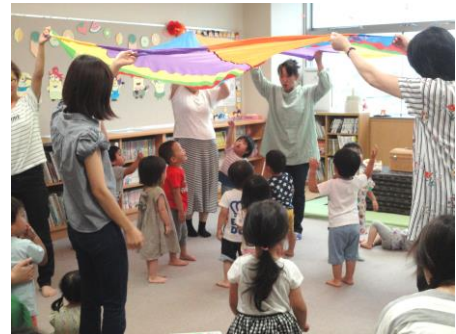
☆かりんとうさんとあそびまSHOW