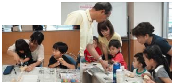
☆夏休み物作り体験 木の車を作りました。