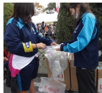
ぎふ羽島駅前フェス

夏休みには、竹鼻保育園の年長園児と交流会を行っています。事前に保育園の先生から園児の様子を教えたいいただき、園児にとって楽しい時間になるよう工夫をしています。生徒の中には、将来、保育士を目指しているものもいて、保育士の仕事の大変さを実感するとともに、保育士になりたいという思いをさらに強くする機会にもなっています。秋には、「ぎふ羽島駅前フェス」に参加し、屋台の