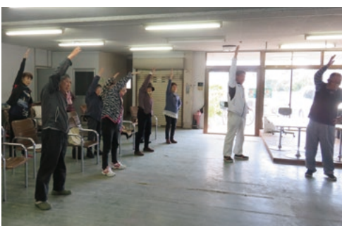
▲お友達と一緒に通っています!

桑原町八神では、今年度から講座修了者が中心となって介護予防教室が立ち上がり、運営されています。この教室は、心身の健康保持だけでなく、閉じこもりを解消することも目的とし