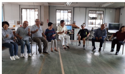
▲わきあいあいとした楽しい教室

ています。教室に参加することで地域の人同士が顔を合わせることができ、この取り組みの大きな利点です。