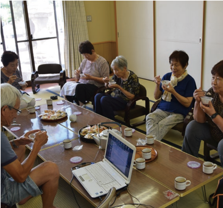
▲世間話ができる憩いの場