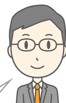
地域包括支援センター

ひとり暮らしの方のご自宅に訪問した際、玄関先に荷物が置いてあり、本人に訊ねると「何の荷物か分からない」と言われました。本人に了承を得て、一緒に中身を確認するとカニやエビなどの海産物が入っていました。本人は「購入した覚えがない」と言い、この荷物をどうしたらよいのか困っている様子でした。