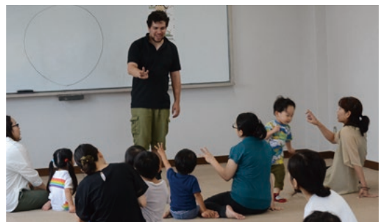
▲親子同士の笑顔がありました

た中での子育てを減らし、子育て中の不安を少しでも解消していただくことを目的としています。