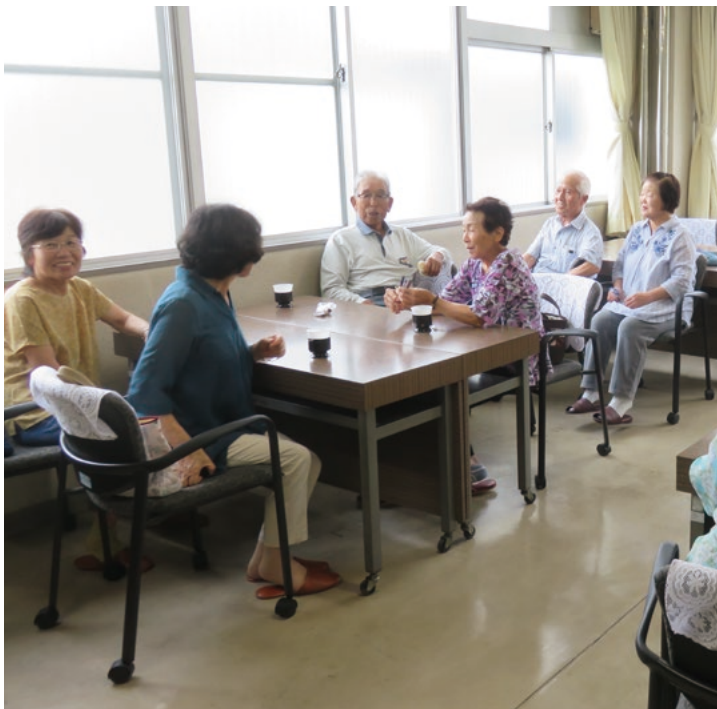
▲ご近所さんとホッと息抜き