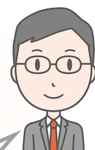
地域包括 支援センター

介護保険の申請をしなくても 基本チェックリスト を実施して、何らかのリスクがあると判定された方については、通所型サービス(デイサービス)などを利用することができるようになります。