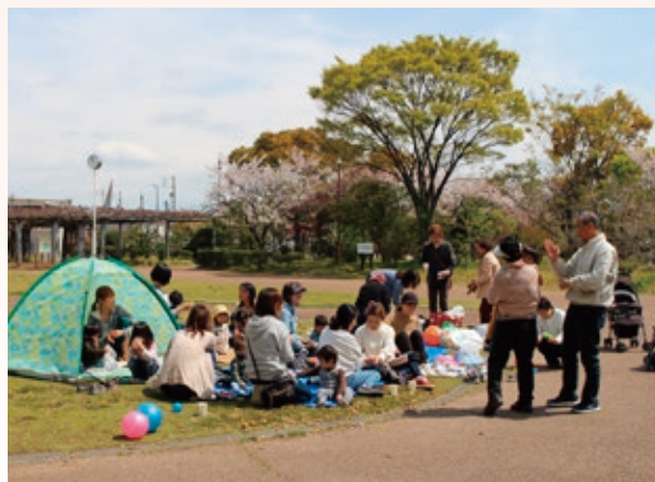
▲公園でピクニック

子どもたちの笑顔や元気な姿を見ることが毎回の楽しみで、誰かのために何かができるという喜びもあり、やりがいを感じながら活動をしています。