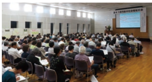
▲9月4日 不二羽島文化センターにて

第41回羽島市社会福祉大 会は、民生委員や社会福祉 委員など、地域福祉の推進 に携わっていただいている