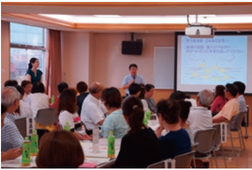
▲地区ごとで話し合いました

6月と8月に、福祉ふれあい会館において、社協竹鼻支部の役員と社会福祉委員の方々を対象に、合同研