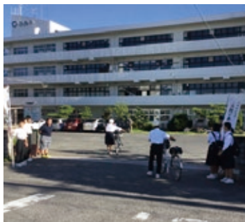
▲毎朝のあいさつ運動

そのために、思いやりの心を育む豊かな心づくりを指導の重点のひとつにして実践しています。自然にできる「あいさつ運動」が広がるように、毎朝、生徒会執行部や生活委員の生徒が中心となって、校門であいさつをしています。