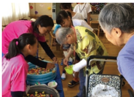
▲福祉施設における交流

このような自他を大切にする資質向上をめざしたボランティア活動に、今後も積極的に参加し、地域に貢献できる生徒を目指していきたいと考えています。