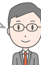
地域包括 支援センター

基本チェックリストの実施を希望する方や、「事業対象者」について詳しく知りたい方は、地域包括支援センターにご相談ください。