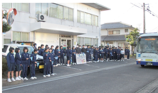
▲あいさつストリート活動の様子（※昨年の様子）