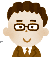
地域包括 支援センター

福祉用具を購入またはレンタルをする判断の目安を示させていただきますので、どちらを選択するほうが良いのか、一緒に考えましょう。