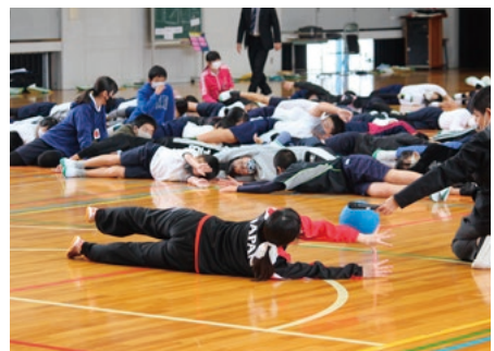
▲ゴールボール体験