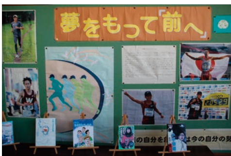
▲オリパラ紹介コーナー

「誰もが幸せにくらす羽島市にしたい」「よりよい未来を自分たちの手で創りたい」そんな「夢をもって前へ」進む竹鼻小学校の子どもたちです。