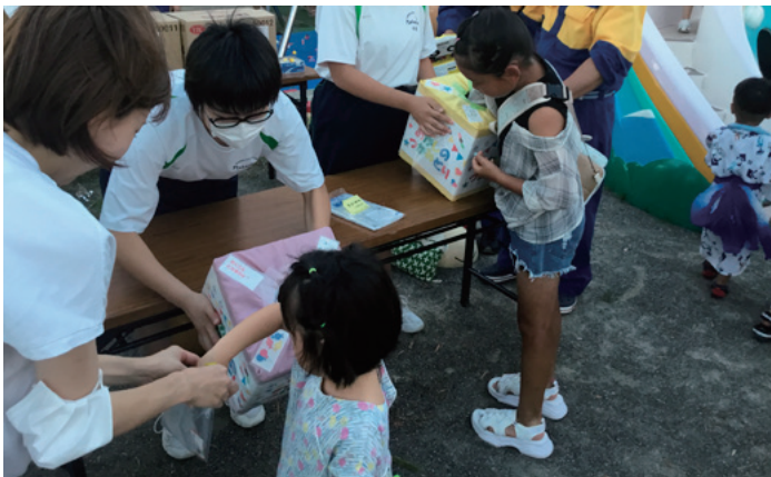
▲地域の皆さんの笑顔を励みに活動する生徒

なり、中学生が運営に携わる機会が増えてきました。8月には下町の夏祭りが行われ、ボランティアを募集したところ、多くの生徒が参加し活動を支えました。地域のボランティアに参加することは、学校外でも、人の役に立つことを発揮する力や、状況に応じて自分にできることを考えて動く力が試されます。当日は、くじ引きの係や、ゲームの係などを分担し、地域の皆さんに楽しんでいただくことができました。