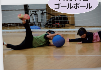
11月11日 ゴールボール