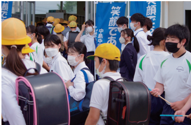
▲小学生の皆さんと一緒にあいさつ

昨年度から、朝の登校時間に中島小学校と堀津小学校を訪れ、一緒にあいさつ活動を行う日を設けました。以前通っていた小学校で、小学生の皆さんや地域の方も交えて元気な声が返ってきて、交流が広