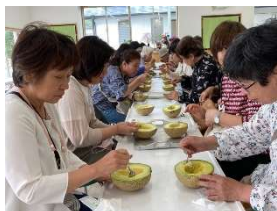
◀ 楽しみな年に 1回の旅行