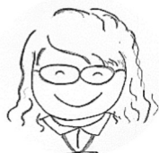
生活支援 コーディネーター

一緒に老人クラブで活動する前は、4人は同じ地域に住んでいたものの挨拶をする程度の関係の方もいたそうです。老人クラブの活動をきっかけに交流を深め、普段でも気かけ合ったり、支え合ったりする関係になりました。「おしゃべり」が心身の支えにもなっていることがありありと感じられる素敵でおしゃれな「4人組」ですね。