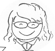
生活支援 コーディネーター

また、「まだ〇〇さん来ていないね」「気をつけて帰ってね」などといった声が聞こえ、気かけ合う関係があり、とても素敵な取り組みだと思いました。