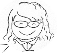
生活支援 コーディネーター

ボランティアの方は、「挨拶をしてくれると元気が出る」とうれしそうにお話しされました。