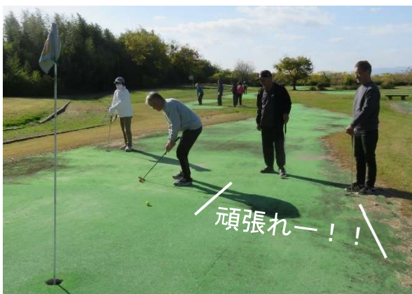
▲声援と歓声で盛り上がっています

住み慣れた地域でいつまでも元気に暮らすつながりや支え合いが、SUKAボギーズの活動を通してたくさん生まれています。