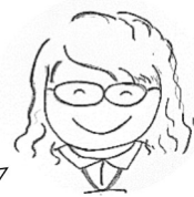
生活支援 コーディネーター