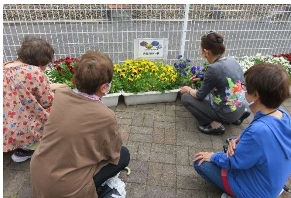
▲「花づくりが4人をつないだね」

ひとり暮らしの方は「誰とも話さない日は、なんとなく不安になる。そんな時は3人の誰かに電話して、おしゃべりをしている。気持ちが落ち着くから」と話されます。「困ったことがあれば相談してね」といつも声をかけてくれる。この3人が近くにいてくれるので、ひとりでも安心してここで暮らすことができる」ともお話されました。