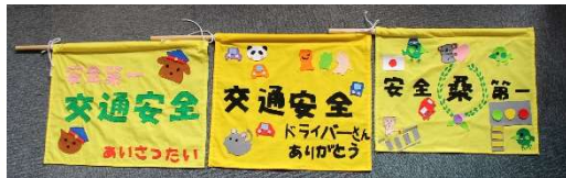
▲昨年度6年生の子どもたちから、手作りの旗のプレゼント