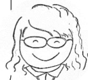
生活支援 コーディネーター

皆さんのお話を聞いて、「自分ができること」で、自分もまわりも楽しく過ごされている様子が伺えます。お互いを思い合う温かさを感じました。