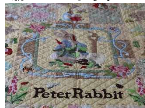
パッチワーク歴20年の 会員さんが作製したタペストリー

好きなことや、やりたいことを誰かと一緒に楽しく、でも自分のペースで行うことが、継続するコツであり、元気に暮らす秘訣になると感じさせていただきました。