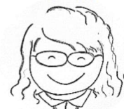
生活支援 コーディネーター

健康づくりはもちろんですが、「今日〇〇さん来るかな?」といった会話がお互いを気にかけて、見守りにもつながっています。また、体調やゴミの出し方、楽しい思い出話など…何気ないおしゃべりが、自然に情報交換になっています。とても素晴らしい地域のお宝です。