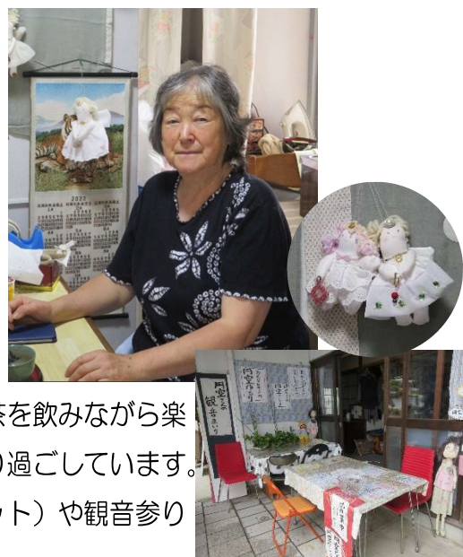
▲玄関前で涼みながら過ごすことも

みんなで楽しいことをやろうと思い、円空市場（フリーマーケット）や観音参りなども企画・実行しています。