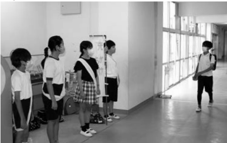
▲玄関でのあいさつ運動

たちにあいさつをしています。各教室を回って、元気なあいさつを届けている子どももいます。