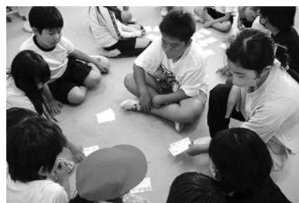
▲フレンズ活動の様子

遊びをする中で、上級生には下級生を思いやった言動がたくさん見られます。そんな優しい姿に触れて、下級生は、上級生のお兄さん・お姉さんを尊敬し、「自分もこうなりたい」と憧れの気持ちをもちます。 学級や学年を超えた集団の遊びをすることで、全校がつながり、お互いを大切に思う気持ちも広がります。