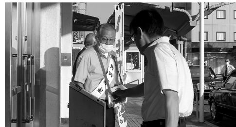
岐阜羽島駅前の募金活動