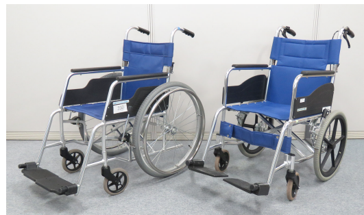
自走式(左)と介助式(右)

共同募金受配事業 車いすをお貸しします 市内在住の人で、身体上または精神上的の障がいがあるため、日常生活に支障がある人を対象に、車いすをお貸しします。 ※病院、福祉施設等へ入院・入所している方は対象となりません。 【貸出期間】 月1回・1週間以内(7泊8日)。ただし、公的な制度により給付等が見込ま