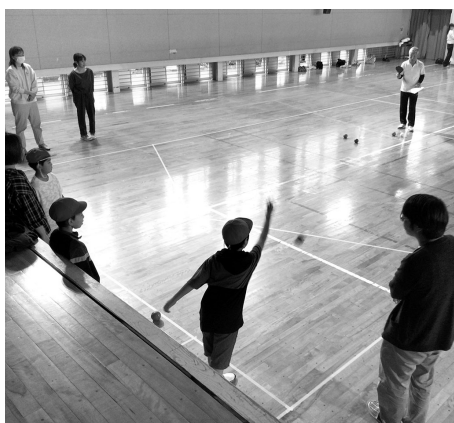
▲親子ポッチャ体験

その経験を生かし、次は、特別支援学級のみんなとポッチャ交流を行いました。「○○さん、がんばって」「○○さん、うまい」など、名前を呼び合って交流を深めることができました。