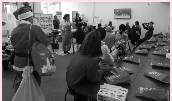
▲クリスマスソングを歌いました

桑原町の高齢者・障がい者・子どもが参加して、ゲーム等を通して楽しく交流することができました。