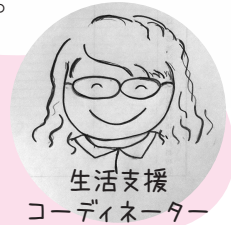
生活支援 コーディネーター

1ゲームが終わるたびに休憩も、いすを並べて座り、家族だんらんのようにおしゃべりしながら、ほんわかした空気に包まれていました。