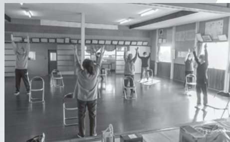
▲ラジオ体操で心も体もスッキリ！

また、働いていた頃は地域との関わりがなく、顔見知りの方も少なかったですが、三ツ柳なかよし会の皆さんと知り合うことができ、会場で会うのが楽しみになっています。