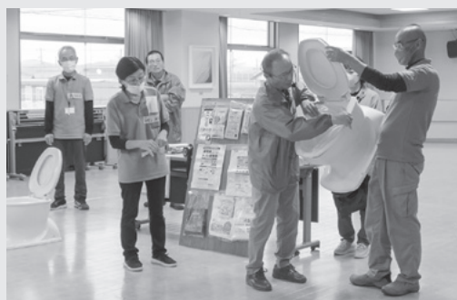
▲携帯用トイレの使い方を実演する 羽島市防災研究会の皆さん

ともに、ボランティアの受付から活動開始までの一連の流れや、役割分担に応じた手順等について確認しました。また、羽島市防災研究会の皆さんから、災害時のトイレの使用について、ビニール袋や凝固剤の使い方などを学びました。