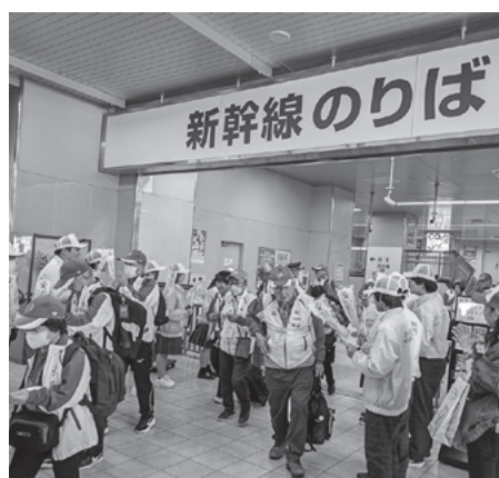
▲岐阜羽島駅でのお出迎え

見送りをしました。「おもてなしキーホルダー」を製作し、お出迎えの際に810人にお渡しすることができました。手作りのキーホルダーに大変喜んでいただき、すぐにかばんにつけてくださる方や手作りという言葉に大変驚かれた方もみえました。心を込めて製作し、多くの方に喜んでいただき、私たちもとても嬉しかったです。