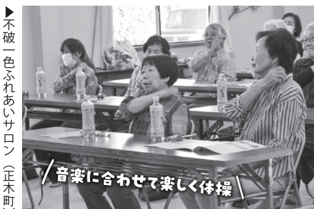
▶ 不破一色ふれあいサロン (正木町)