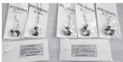
▲配布した「おもてなしキーホルダー」

10月18日から21日の4日間にわたり「ねりんピック岐阜2025」が開催され、岐阜羽島駅で、全国からみえる出場選手のお出迎えとお