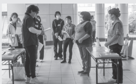
▲受付の説明をするスタッフ

本会では、災害が発生し同センターを設置した場合に、迅速に対応できるよう毎年訓練を実施しています。今回の訓練では、災害協定締結団体や協力団体である羽島市役所、羽島市防災研究会、羽島青年会議所、羽島ライオンズクラブの皆さんと