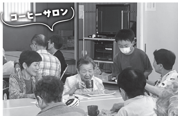
◀ 須賀ふれあいサロン (正木町)