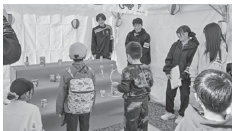
▲ぎふ羽島駅前フェスで縁日のボランティア活動

羽島市唯一の高校として、積極的に地域行事のボランティアに参加しています。「赤い羽根共同募金」や「ぎふ羽島駅前フェス」など、今後もボランティア活動を通して地域の皆さんと交流し、羽島市の活性化に貢献できたらと思っています。