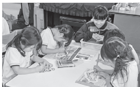
▲魚の色塗りをする園児と生徒

会の代表的な活動の一つが、竹鼻保育園の園児達との交流会です。今年度は夏祭りを一緒に楽しむことができました。魚の絵に色を塗ってもらい魚釣りをしたり、輪投げ、ワニワニパニックをしたりして、高校生と一緒に夢中になって、楽しんでいる姿が印象的でした。「園児の質問に答えるのは難しかったけれど、そういう疑問をもったんだと新しい視点に気づきました」など、生徒たちは保育園は保育園の先生の大変さなども交流から学ぶことができました。