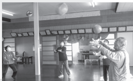
▲人気ナンバー1のボール体操