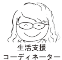
生活支援 コーディネーター

いきなりその質問！？と驚きましたが、「あなた、どこの人？」というひと言は、人とのつながりを生む魔法の言葉のように感じました。