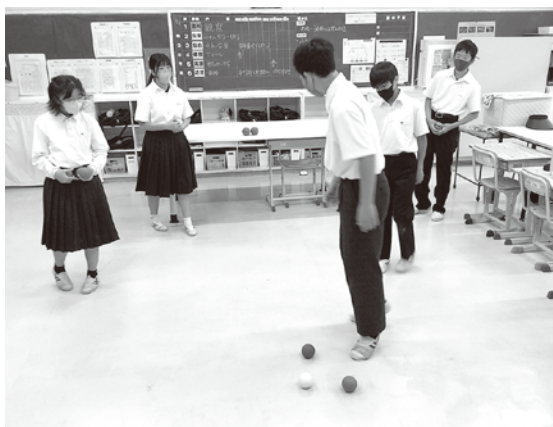
▲仲間と作戦を立てながら交流中

スポーツは、プレイだけではなく、「支える」ことや「広げる」こともできます。これからも多くの声かけをして交流します。