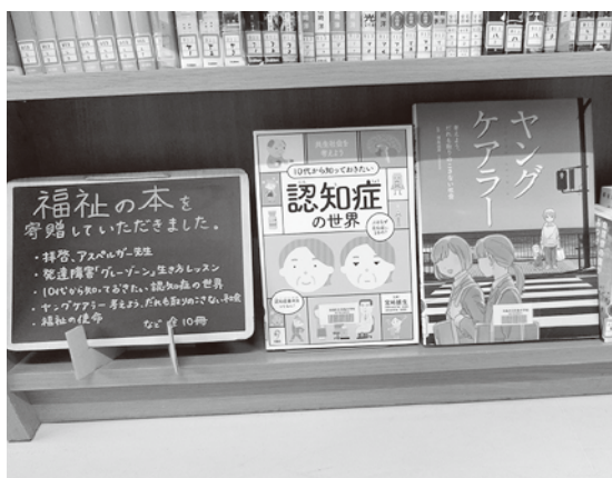
▲福祉コーナーにて紹介